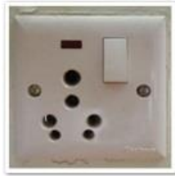
เต้าเสียบ

ปลั๊กไฟที่เนपालเป็นแบบสามรูหัวกลมไฟ 220 โวลท์